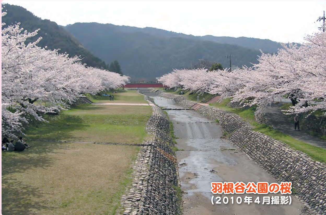
羽根谷公園の桜 (2010年4月撮影)